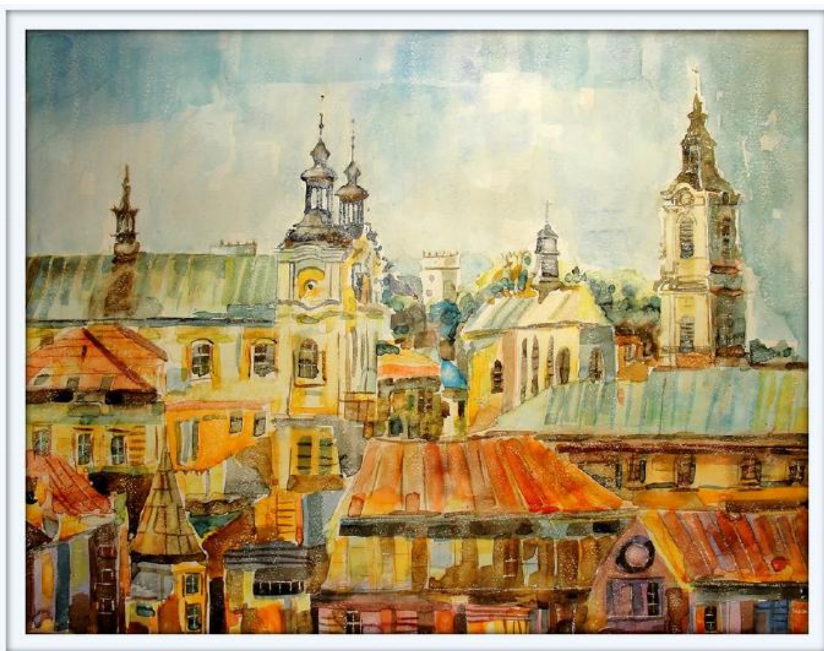
Przemysł, widok z Wieży Zegarowej, 2014 - akwarela na papierze Montval 300 (50 x 65 cm.)