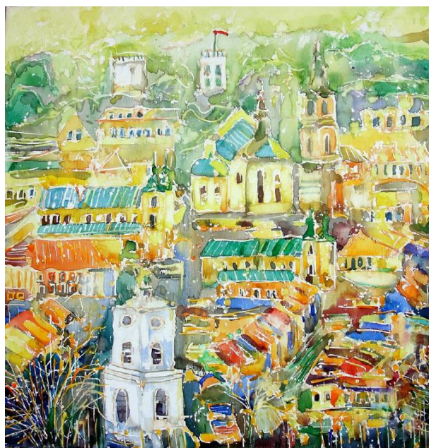
Sen o Przemysłu, 2015 - akwarela na płótnie (50 x 50 cm.)

Fragmety wywiadu Łukasza Szymańskiego "Henryk Lasko - nauczyciel, informatyk, grafik, malarz", Podkarpackie Maki nr 3, sierpień 2016 r.