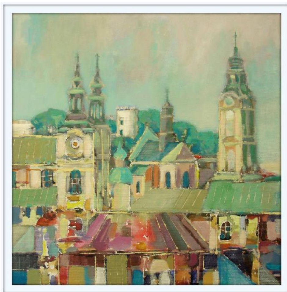
Przemyska impresja I, 2013 - akryl na płótnie (50 x 50 cm)

Posiada galerię autorską na stronie: lasko.webd.pl gdzie na bieżąco umieszcza reprodukcje swoich prac malarskich i graficznych.