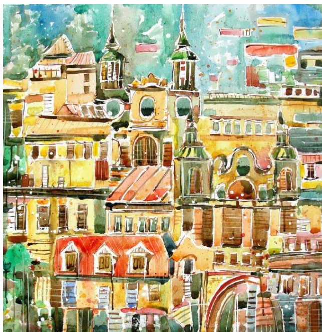
Przemyska impresja, 2016 - akwarela na płótnie (70 x 70 cm)

art. plastyk dr Elżbieta Cieszyńska "Henryk Lasko - impresje malarskie" Nasz Przemyśl, wrzesień 2009, nr 9 (60) s.27